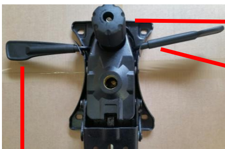
Výšková regulace židle