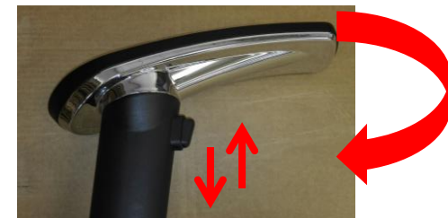
1B područky – výškově regulovatelné, otočné vlevo/vpravo